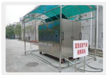
膜分离氮气循环气调储粮现场图