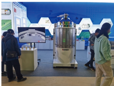
入选“国家‘十三五’科技创新成就展”

核心成果柔性碾米机，采用柔性砂带替代已一个半世纪的刚性碾米砂辊或铁辊，大米出品率可提升 5~8 个百分点以上。与传统碾米机相比，加工籼米时碎米率下降 6 个百分点以上(粳米碎米率下降 3 个百分点以上)，吨米电耗下降 10kWh，糙米加工成白米时米粒温度上升幅度下降 15℃以上，调整参数还可生产留胚米。技术评价结论“达到国际领先水平”。