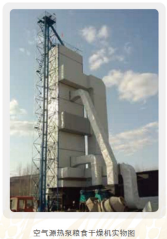
空气源热泵粮食干燥机实物图