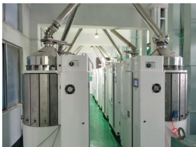
大米车间应用现场之一